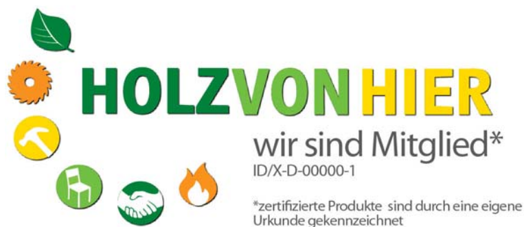
Abb. 1: Variante Mitgliedschaft