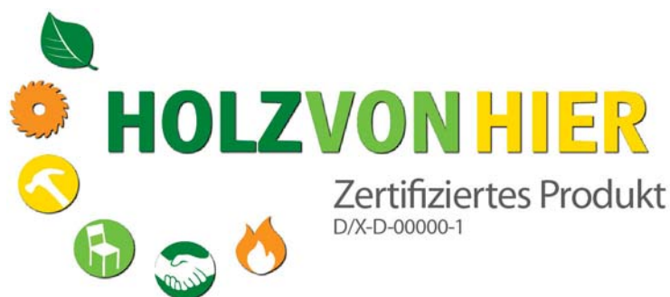
Abb. 2: Variante 'zertifiziertes Produkt'

Eine Kennzeichnung von Produkten ist nur mit der Logovariante 'zertifiziertes Produkt' möglich.