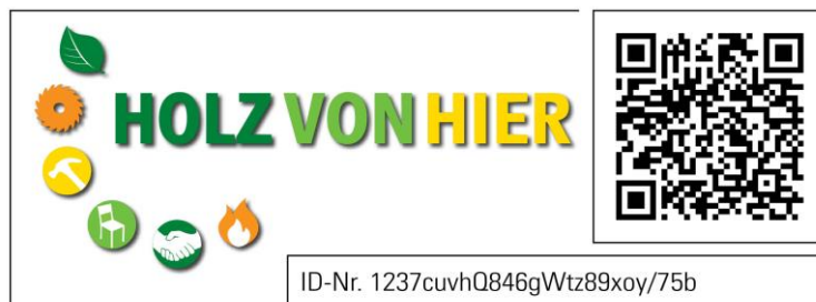
Abb. 2: Variante 'zertifiziertes Produkt'

Eine Kennzeichnung von Produkten ist nur mit der Logovariante 'zertifiziertes Produkt' möglich. Dieses Logo wird im Zuge einer Transaktion über das elektronische controllingsystem generiert.